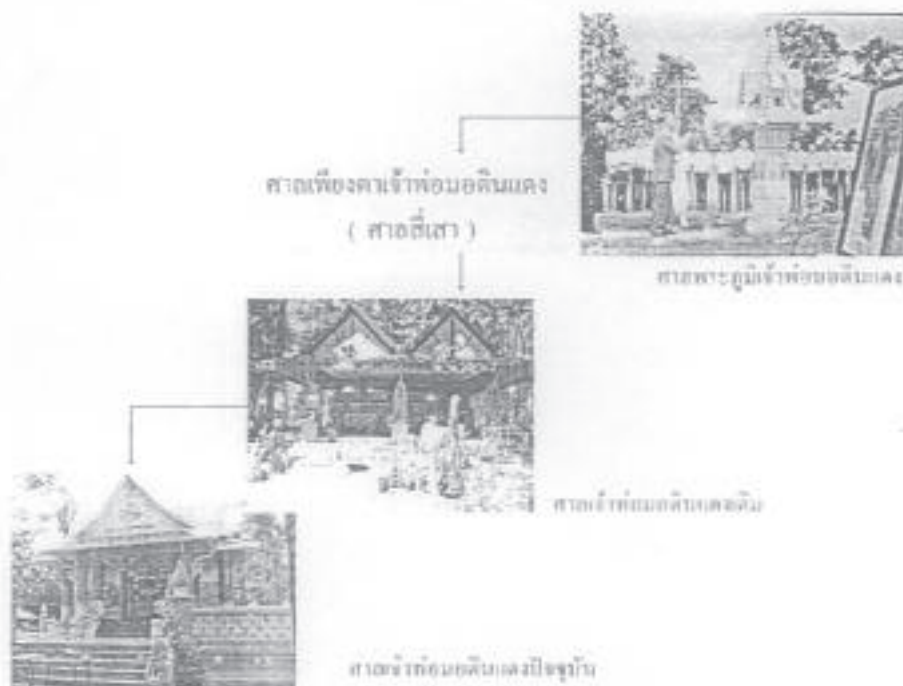
รูปที่ 2 4 ลำดับขั้นขั้นตอนการสร้างศาลเจ้าพ่อมอดินแดง จากอดีตสู่ปัจจุบัน

ลำดับขั้นของการเปลี่ยนแปลงการสร้างศาลเจ้าพ่อมอดินแดง สามารถอธิบายได้ดังรูปดังกล่าวนี้