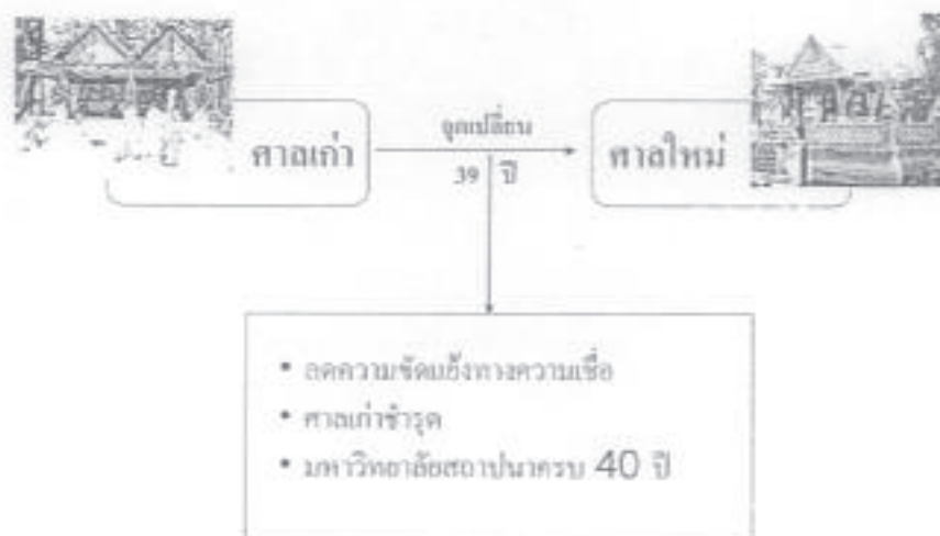
รูปที่ 3 6 จุดเปลี่ยน จากศาลเก่าสู่ศาลปัจจุบัน

ทั้งนี้ก็ได้ถือโอกาสซ่อมแซมศาลเก่าที่สุดังไปตามสภาพกาล ด้วย และประกอบกับเป็น การสร้างศาลใหม่เพื่อความเป็นสิริมงคลของมหาวิทยาลัยเนื่องในโอกาสครบรอบ 40 ปี แห่งการ สถาปนามหาวิทยาลัยขอนแก่น โสภสามารถอธิบายได้ดังแผนผังนี้